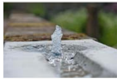
Wasserlement Andacht u. Kinderspiel