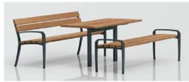
Tisch-Bank Kombination FA Runge